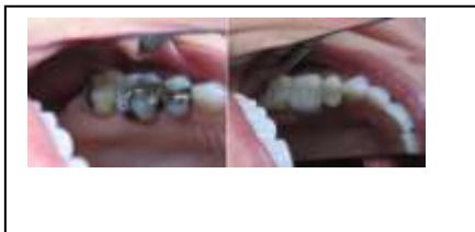
Τερηδόνα στο όριο του σφραγίσματος.

Τα σφραγίσματα είναι αναγκαίες επιδιορθώσεις που γίνονται από τον οδοντίατρο στα δόντια, όταν αυτά καταστρέφονται μερικώς, συνήθως από τερηδόνα. Αυτές οι αποκαταστάσεις των δοντιών πρέπει να έχουν διάρκεια ζωής πέντε ετών τουλάχιστο, προτού χρειαστούν αντικατάσταση. Τα ασημένια σφραγίσματα(αμάλγαμα) έχουν μεγαλύτερη διάρκεια ζωής με μέσο όρο οκτώ χρόνια, από τα άσπρα(ρητινούχα)χρώματος δοντιού, σφραγίσματα. Εν τούτοις, η συνεχής πίεση από τη μάσηση ιδίως στα πίσω δόντια (που εξασκείται διπλάσια δύναμη από τα μπροστινά) και το τρίξιμο των δοντιών μπορεί να προκαλέσουν φθορά, ρωγμές, θραύση ή και πέσιμο ενός σφραγίσματος. Άτομα που τρίζουν και σφίγγουν τα δόντια τους το βράδυ, ονομάζονται βρουξιστές και έχουν πολύ μεγαλύτερη πιθανότητα για φθορές των σφραγισμάτων στο στόμα τους.